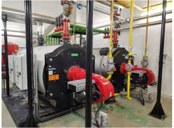
Un avant-après La chaufferie a revêtu son habit de lumière !

Les premiers résultats de cette opération sont prometteurs : une baisse de 7°C a été enregistrée sur les températures de retour du réseau de production de chaleur, témoignant de l'efficacité de cette mesure simple.