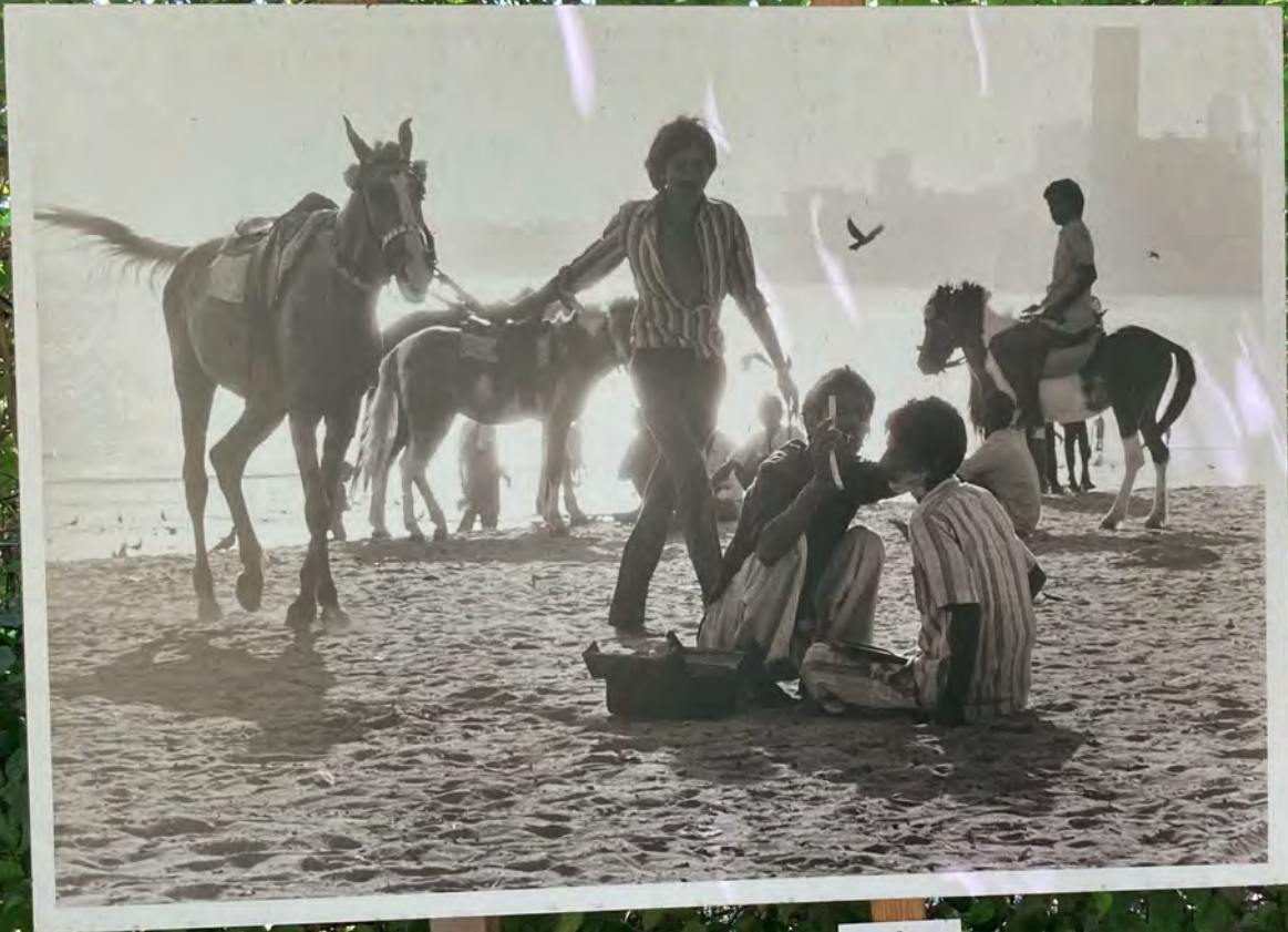
● Inde (1999)