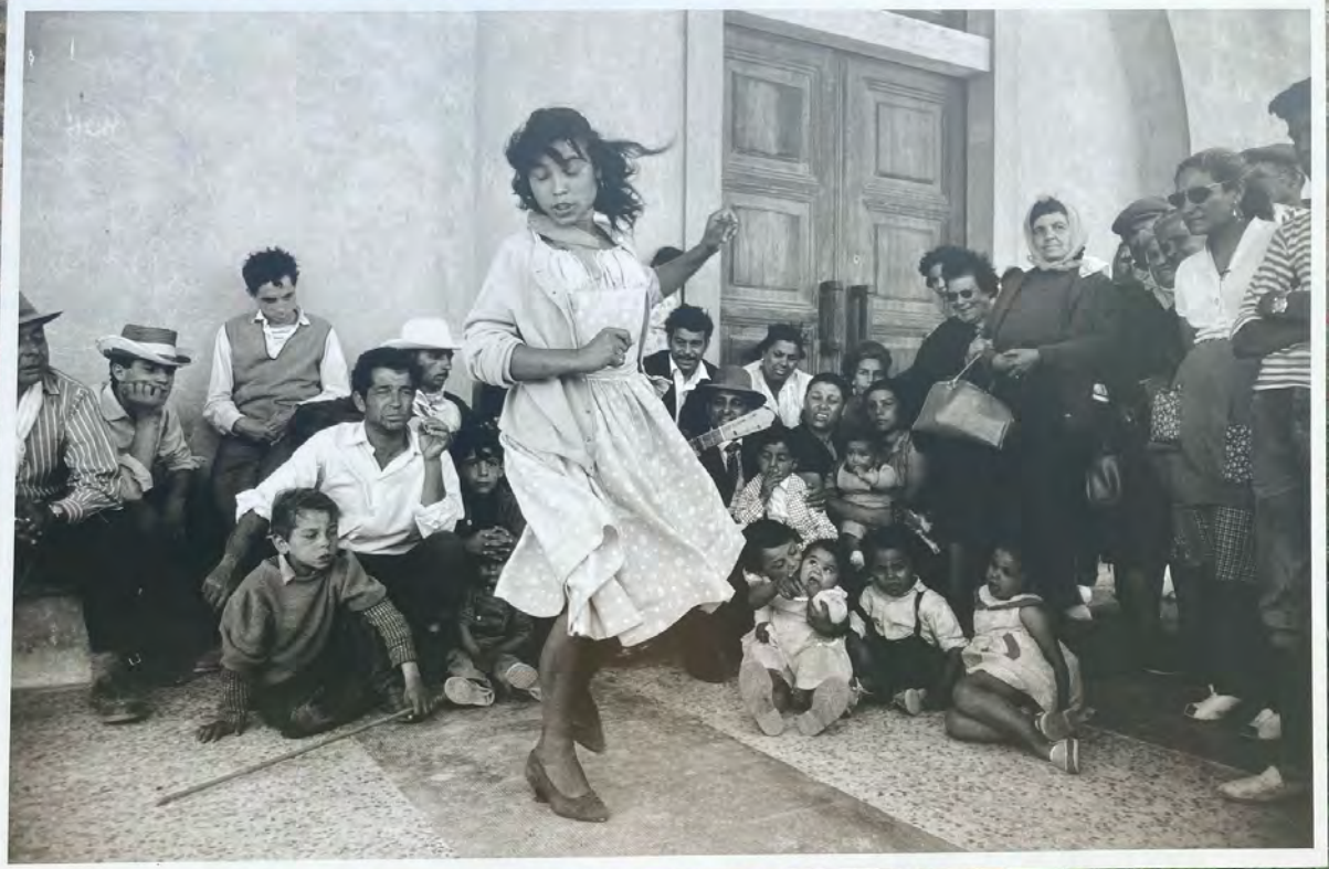
● France (1960)