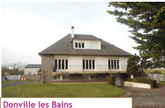
Donville les Bains Hôpital de jour enfants