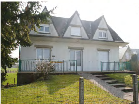
Pontorson Centre Médico-Psychologique Equipe Mobile Adolescents (EMA) Equipe thérapeutique pour le rétablissement et l'empowerment (ETRE)