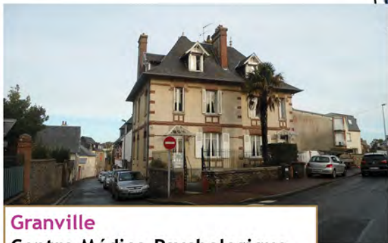
Granville Centre Médico-Psychologique